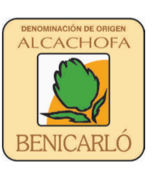
Alcachofa de Benicarló (DOP) COMUNIDAD VALENCIANA