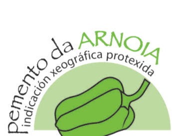
Pemento da Arnoia (IGP) GALICIA