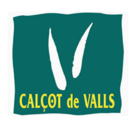
Calçot de Valls (IGP) CATALUÑA