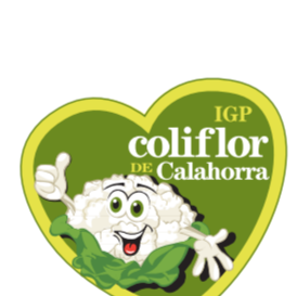
Coliflor de Calahorra (IGP) LA RIOJA