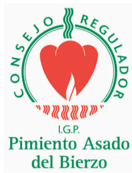
Pimiento Asado del Bierzo (IGP) CASTILLA Y LEÓN