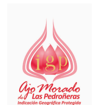
Ajo Morado de Las Pedroñeras (IGP) CASTILLA - LA MANCHA