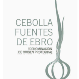
Cebolla Fuentes de Ebro (DOP) ARAGÓN