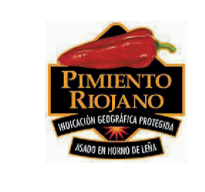
Pimiento Riojano (IGP) LA RIOJA