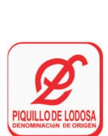
Pimientos del Piquillo de Lodosa (DOP) NAVARRA