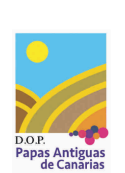
Papas Antiguas de Canarias (DOP) CANARIAS