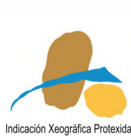
Patata de Galicia (IGP) GALICIA